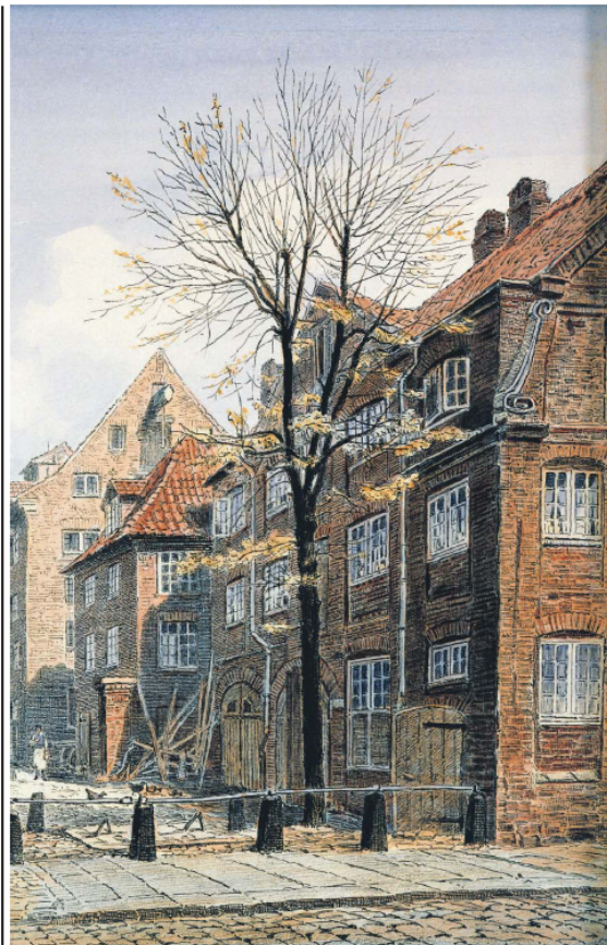
Die Berenberg Bank an der Straße Alter Wandrath in Hamburg um 1886