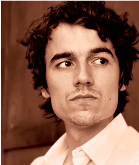
Alexander Khuon · Stipendium 2009

Alexander Khuon ist das Theaterspielen buchstäblich an der Wiege gesungen worden. Sein Vater Ulrich ist einer der renommiertesten Theaterleiter Deutschlands, derzeit Intendant des Deutschen Theaters in Berlin; der 1979 geborene Alexander steht schon als Kind auf der Bühne. Vielleicht ist das der Grund, warum er es wie kaum ein anderer schafft, Theater und Film unter einen Hut zu bringen und in beiden gleichermaßen zu reüssieren. Durch seine Rolle in der »Entdeckung der Currywurst« an der Seite von Barbara Sukowa wurde er dem Kinopublikum bekannt; am Theater ist er schon länger eine feste Größe. Seinen Hamlet am Schauspiel Köln lobte die Kölner Rundschau als »hitzig und depressiv, gefährlich und charismatisch«; am Deutschen Theater gehört er zum festen Ensemble und glänzte u. a. als Trigorin in der umjubelten Inszenierung von Tschechows »Möwe«.