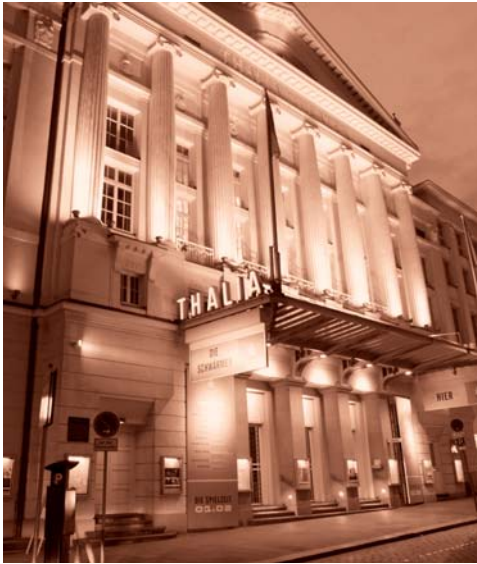
Autorentheatertage Thalia Theater Projektförderungen 2003 und 2006

Das Hamburger Thalia Theater gehört zu den renommiertesten Sprechbühnen Deutschlands. Seit den 80er-Jahren steht das Thalia für ein junges, revolutionäres Theater ebenso wie für anspruchsvolle und kreative Umsetzungen klassischer Bühnenliteratur.