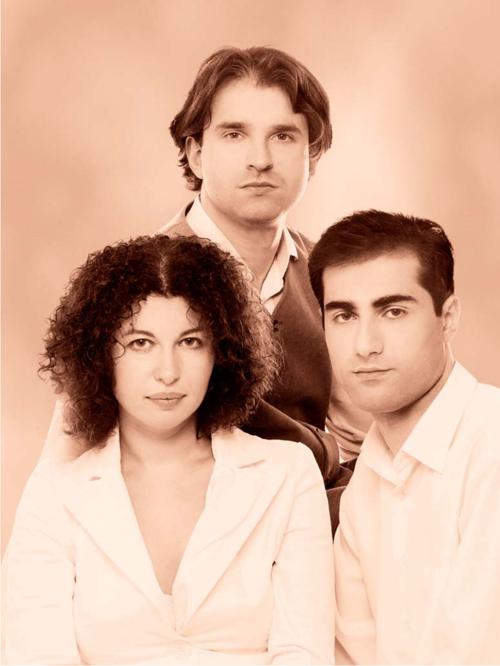
Bonnard Trio - Berenberg Kulturpreis 2010