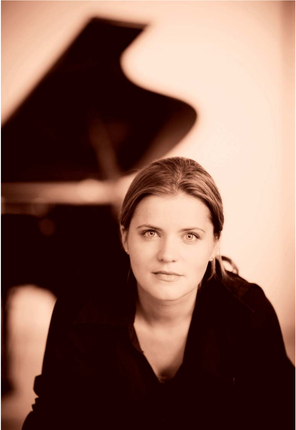
Lauma Skride · Berenberg Kulturpreis 2008