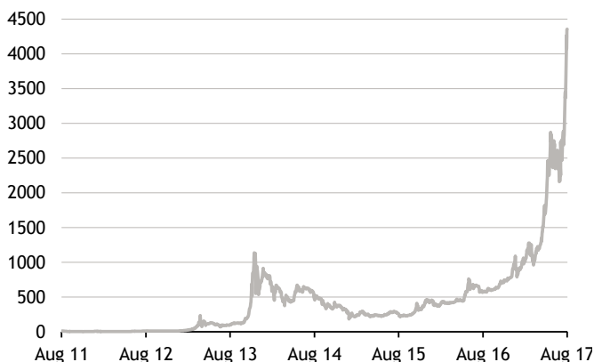
Abb. 1: Wechselkurs Bitcoin/US-Dollar

Kryptowährungen sorgen täglich für Schlagzeilen. 1 Der Preis des „Marktführers“ Bitcoin eilt von einem Rekord zum nächsten. In dieser Woche kostete ein Bitcoin erstmals über 4.000 US-Dollar und hat sich damit seit Jahresanfang mehr als vervierfacht (Abbildung 1). Gerade einmal zwei Wochen zuvor hatte dem Bitcoin noch der Untergang gedroht, da er am 1. August aufgespalten wurde – seither existiert neben dem „ursprünglichen“ Bitcoin die neue Version „Bitcoin Cash“. Bisher hat diese Spaltung der Popularität aber nicht geschadet.