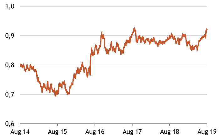
In Britischem Pfund.