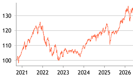
Indexierte Wertentwicklung seit Aufl. (brutto, in %)

Der Berenberg Multi Asset Balanced ist ein vermögensverwaltender ausgewogener Fonds bestehend aus Aktien, Anleihen, Alternativen Investments und Liquidität. Die Steuerung der Investitionsquoten erfolgt aktiv in Abhängigkeit von der relativen Attraktivität der jeweiligen Anlageklasse. Der Fonds investiert weltweit, jedoch mit einem regionalen Schwerpunkt auf Europa. Bis zu 65 % des Portfolios können in die Anlageklasse Aktien investiert werden, bestehend aus Einzeltitelinvestments, aktiv gemanagten Publikumsfonds und passiven Exchange Traded Funds (ETFs). Im Anleihebereich wird schwerpunktmäßig in europäische Papiere guter Bonität investiert. Neben Staatsanleihen und Pfandbriefen wird das Anleiheportfolio auch in Unternehmens- und Finanzanleihen diversifiziert. Aktiver Ansatz, d.h. Indexgewichte haben keinen Einfluss auf die Einzeltitelauswahl.